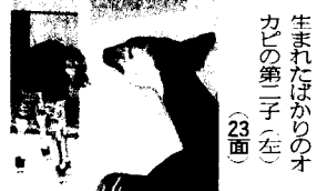
生まれたばかりのオカビの第二子(左)