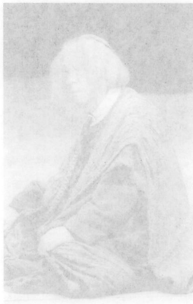
(詩野上文山：源兼 にも豊公の回簡お真等)