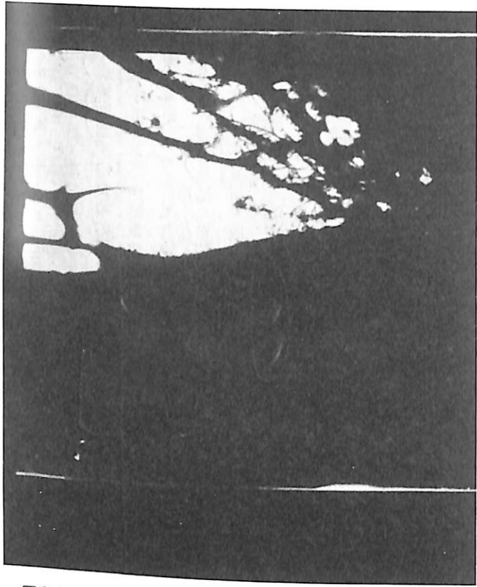
写真6・4 同, 4枚目の写真