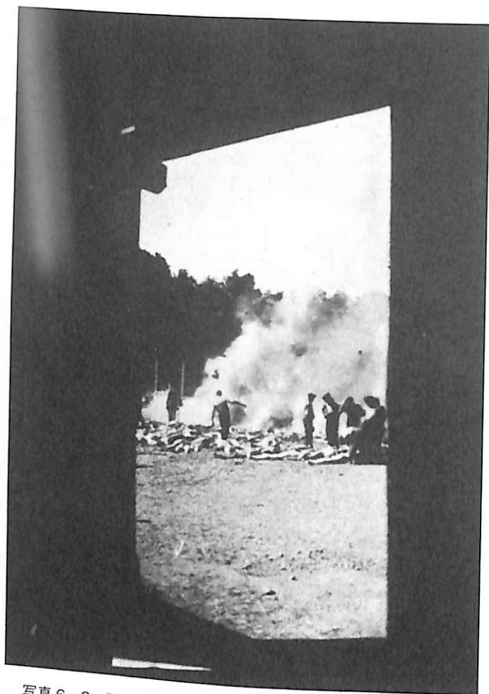
写真6・2 同, 2枚目の写真