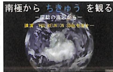
「南極からちきゅうを観る」