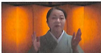
「ようこそ講談の世界へ」