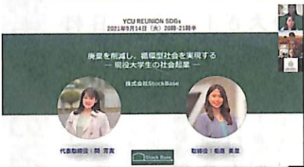
学生起業 (株) Stock Base 「企業の廃棄を削減し、循環型社会を実現する」