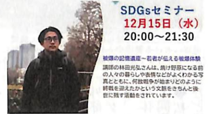
「被爆の記憶を遺す～若者が伝える被爆体験」