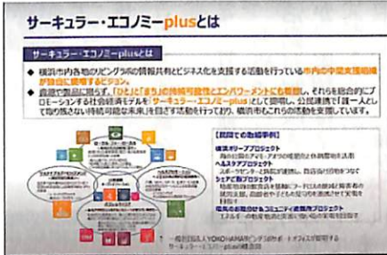
「循環型社会とサーキュラーエコノミー」