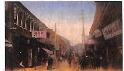
「横浜中華街 160年の軌跡～中華街はなぜここに」