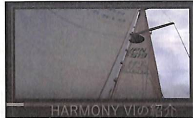
「セーリングヨットで世界一周航海」