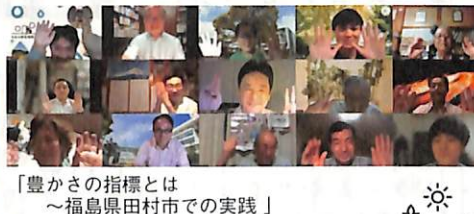
「豊かさの指標とは～福島県田村市での実践」 (福島と繋いで)