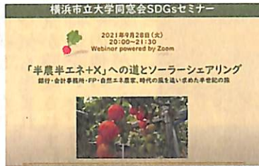
「“半農半エネ+X”への道とソーラーシェアリング」