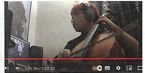
「SDGsにつながるプロボノ・チェロ演奏活動」