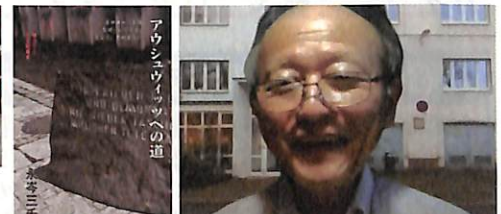
「『アウシュビッツへの道』から読み解くヒトラーとブーチンの共通性と差異性」